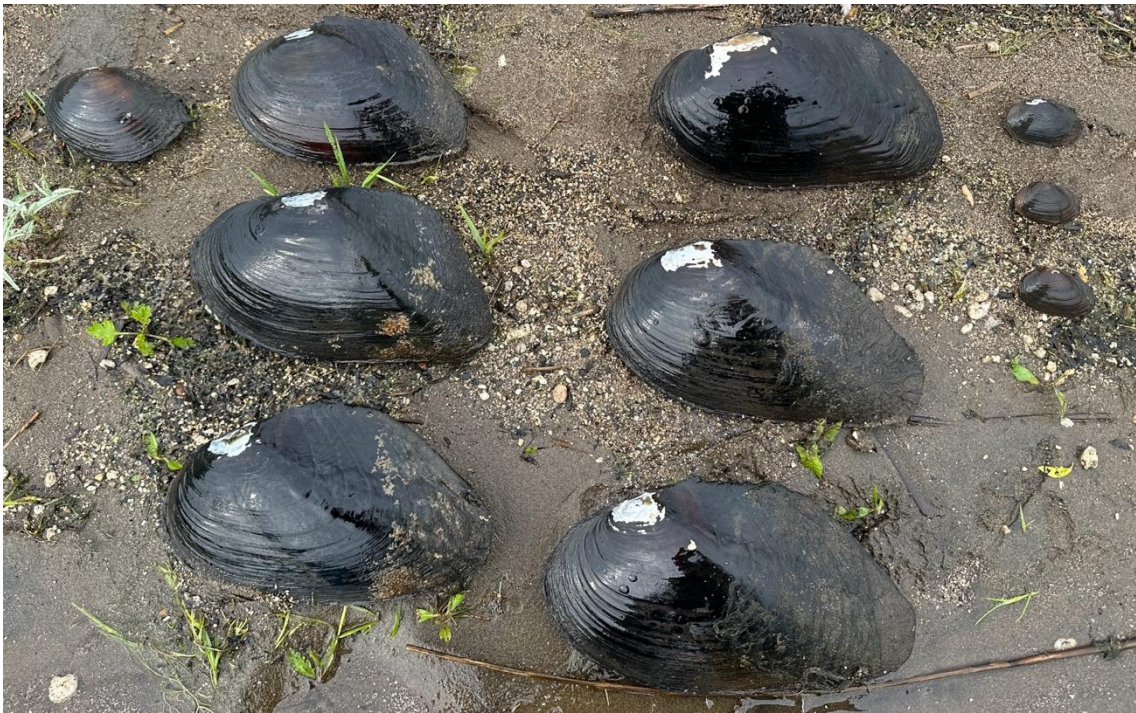
写真3 青森県で採集したドブガイ属貝類、イケチョウガイ、ヨコハマシジラガイ