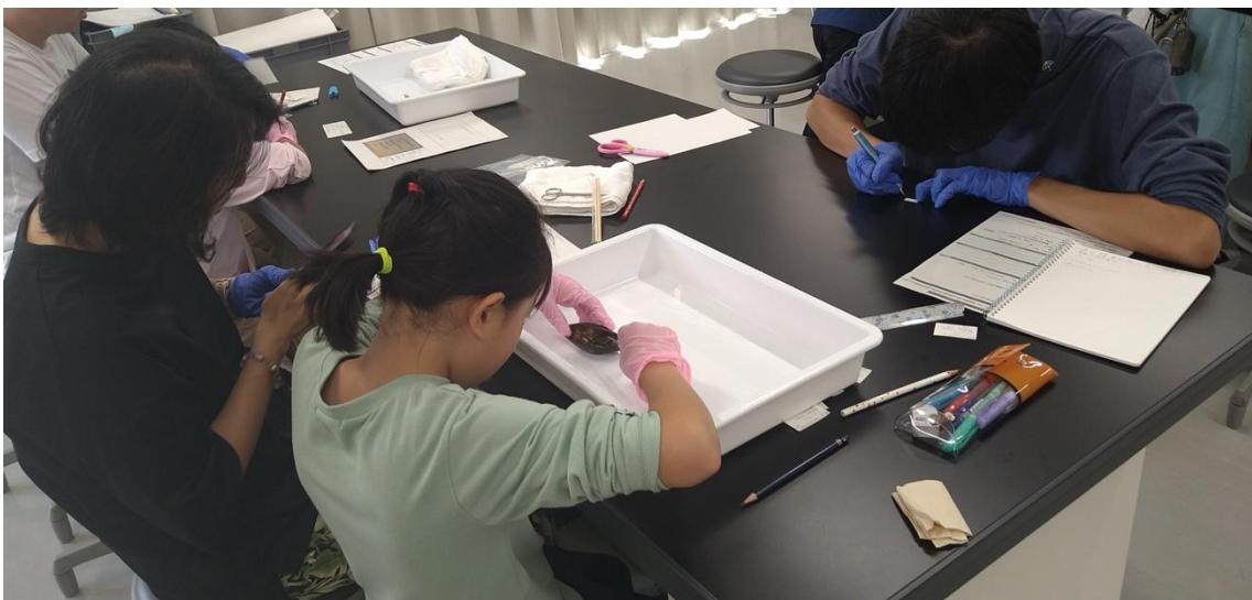
写真8 [博物館で標本づくり「貝類」] ワークショップでの標本作製風景