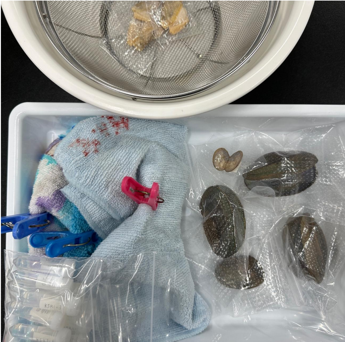
写真9 標本作製後の風景（殻乾燥標本、軟体部の液浸標本）