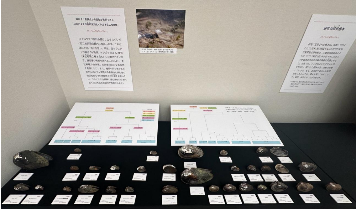
写真6 第37回企画展「標本 あつめる・のこす・しらべる・つたえる」での全32種の展示風景