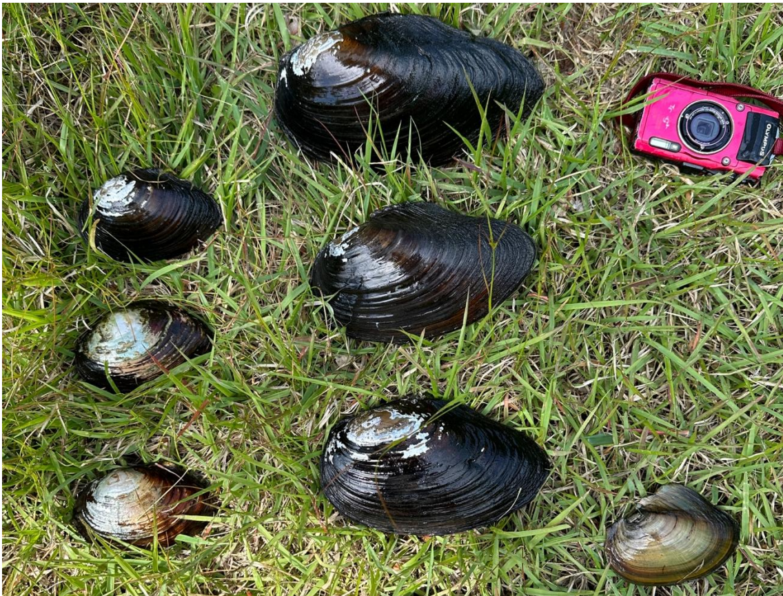
写真4 青森県で採集したカラスガイ、カラスガイ族貝類