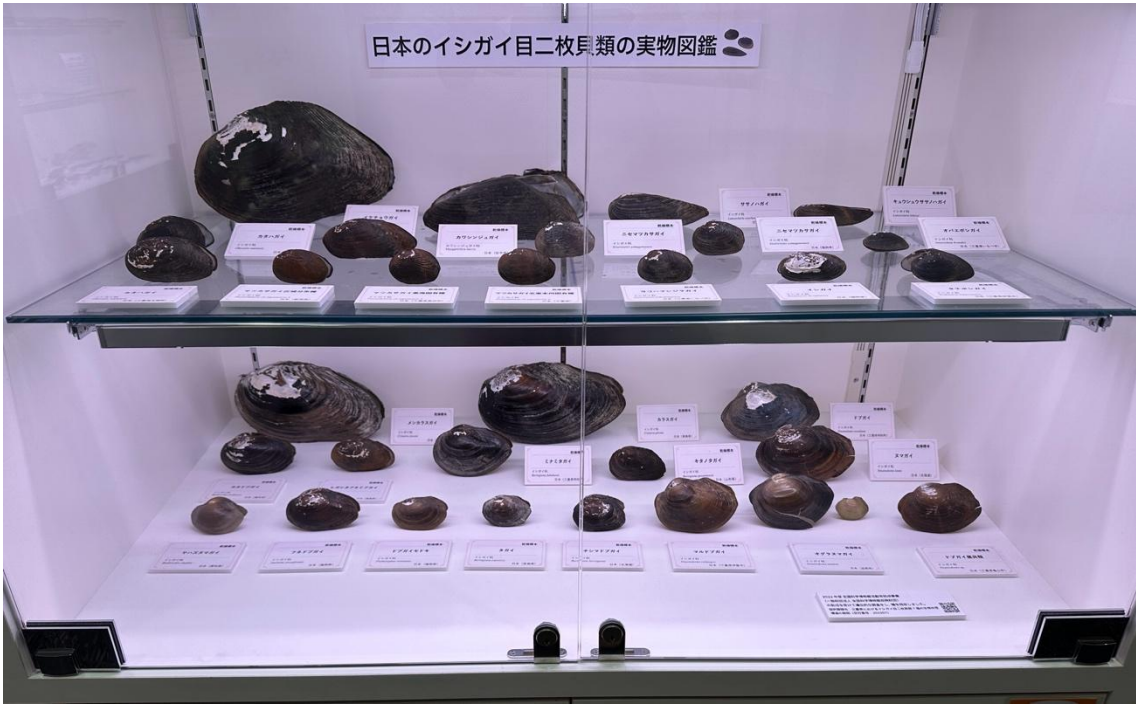
写真5 「三重の実物図鑑」展示室での29種の展示風景