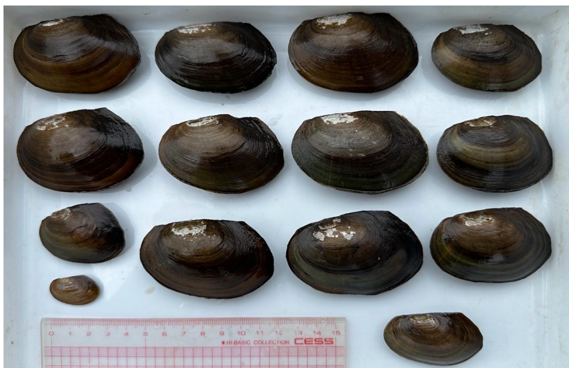
写真2 九州で採集したドブガイモドキ