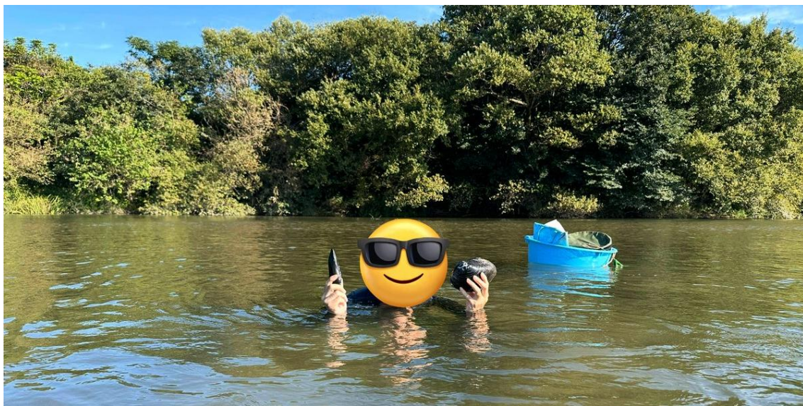
写真1 愛知県の川での二枚貝類(ササノハガイとヤハズヌマガイ)の採集風景

これらの展示やワークショップを実施した経験を得て、申請者らは、観覧者がより深い学びを得られるような展示を目指して、引き続き改善して試行していく予定である。