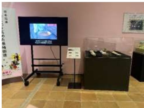
砂糖製造の映像と砂糖標本

鉱石については、当館岩石・鉱物担当学芸員の協力により、春夏秋冬の菓子をテーマに、春は牡丹餅に似た赤鉄鉱、夏は琥珀糖に似た蛍石、というように、菓子に似た鉱石を展示した。意外な組み合わせに足を止める方が多くみられた。