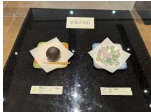
お菓子に見える鉢物の展示