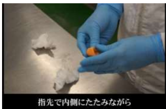
菓子製造動画（株式会社如水庵提供）