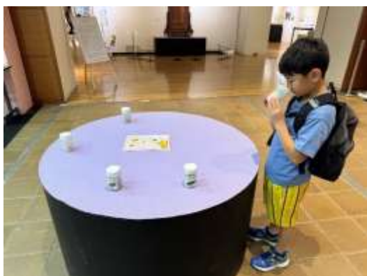
お菓子の香りコーナー