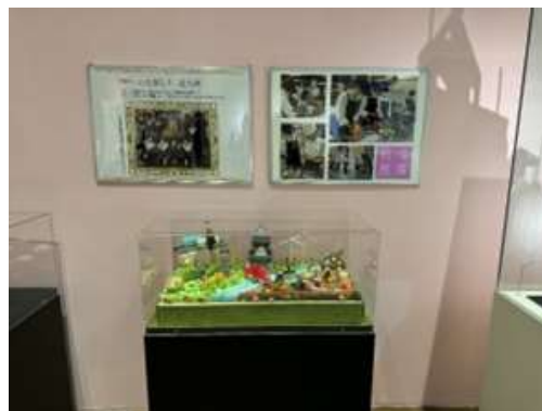
折尾愛真高等学校によるマジパン細工