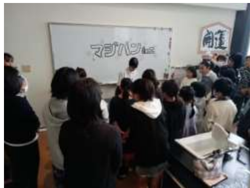
マジパン作りイベントの様子