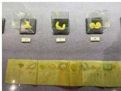
唐菓子の再現展示