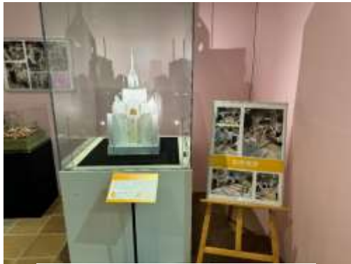
大原学園によるパスティヤージュ