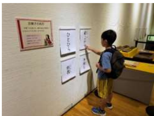
上菓子の名前パネル